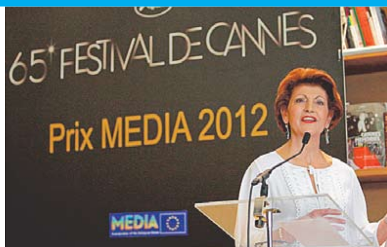
Comisarul Androulla Vassiliou

O metaforă vizuală despre cum, în absența democrației, odrăsește barbaria, cum sunt masacrați mii de civili în indiferența generală, despre impotența organismelor internaționale de „apărare a drepturilor omului”. Patru destine se încrucișează, se întrepătrund: Carole (Bérénice Bejo, actriță franceză oscarizată și palmarizată), trimis special al UE, se atașează de orfanul Hadji, puști cecen care s-a salvat din măcelul în care i-a pierit familia; Raïssa, sora sa mai mare, care-l caută peste tot, și Kolia, studentul rus chemat sub arme, umilit perpetuu, dezumanizat pentru a face față războiului