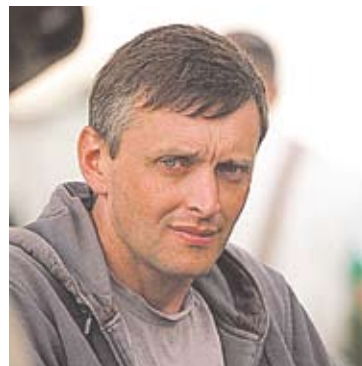
Regizorul documentarului Maidan Nezaļnosti , Serghei Loznitsa