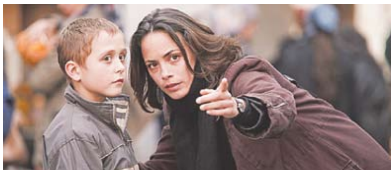
The Search de Michel Hazanavicius

„Premiul Media se atribuie artiștilor în scopul realizării unor filme de înaltă valoare artistică ce vor putea fi vizionate în toată Europa”, a subliniat Androulla Vassiliou. Noul lung-metraj al lui Danis Tanovic abordează tema co-